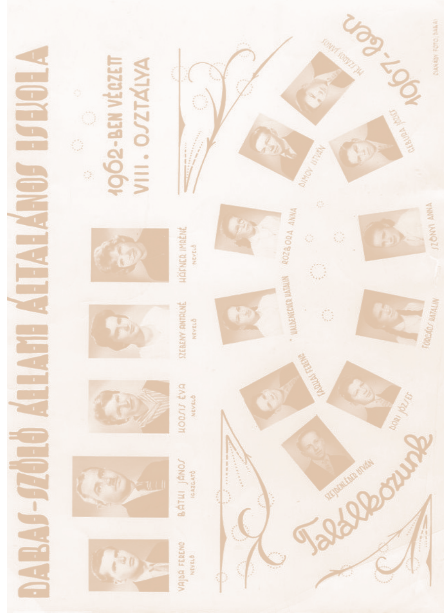
Az 1962-ben végzetek tablója (a grafikát Bárki János igazgató készítette)