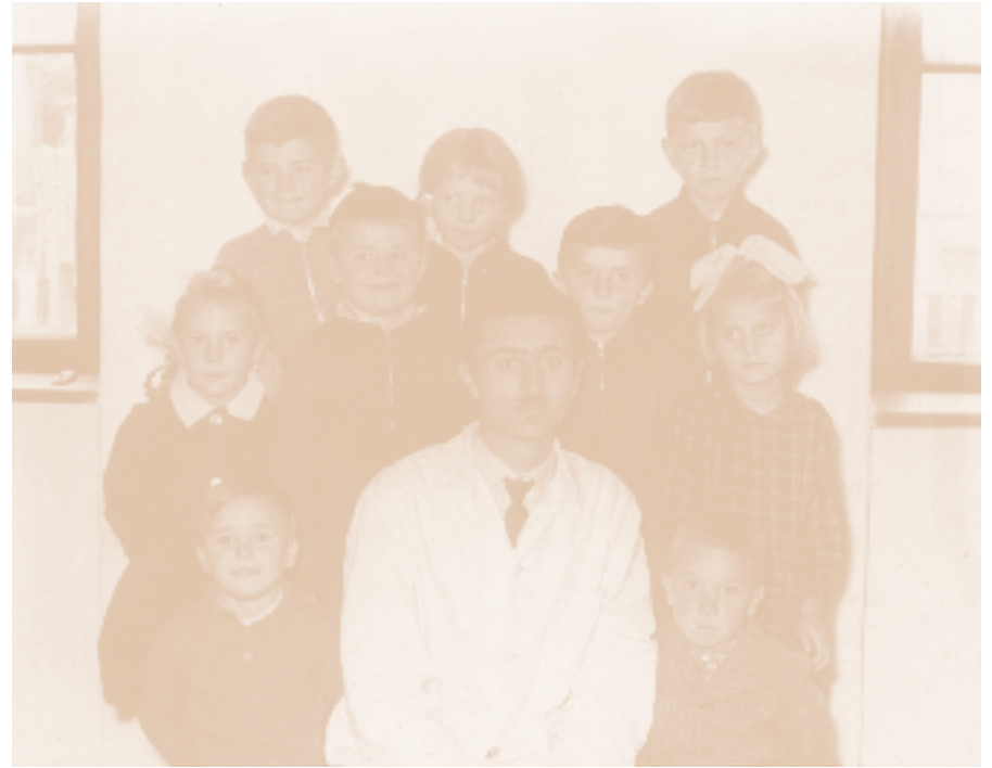
Az 1964-es első osztály képe