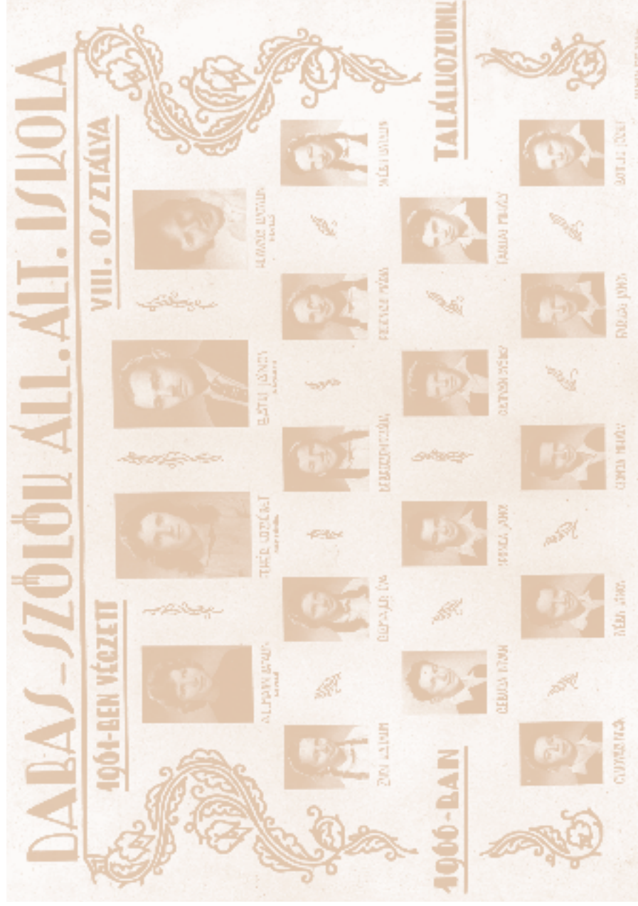
Az 1961-ben végzetek tablója (a grafikát Bárki János igazgató készítette)