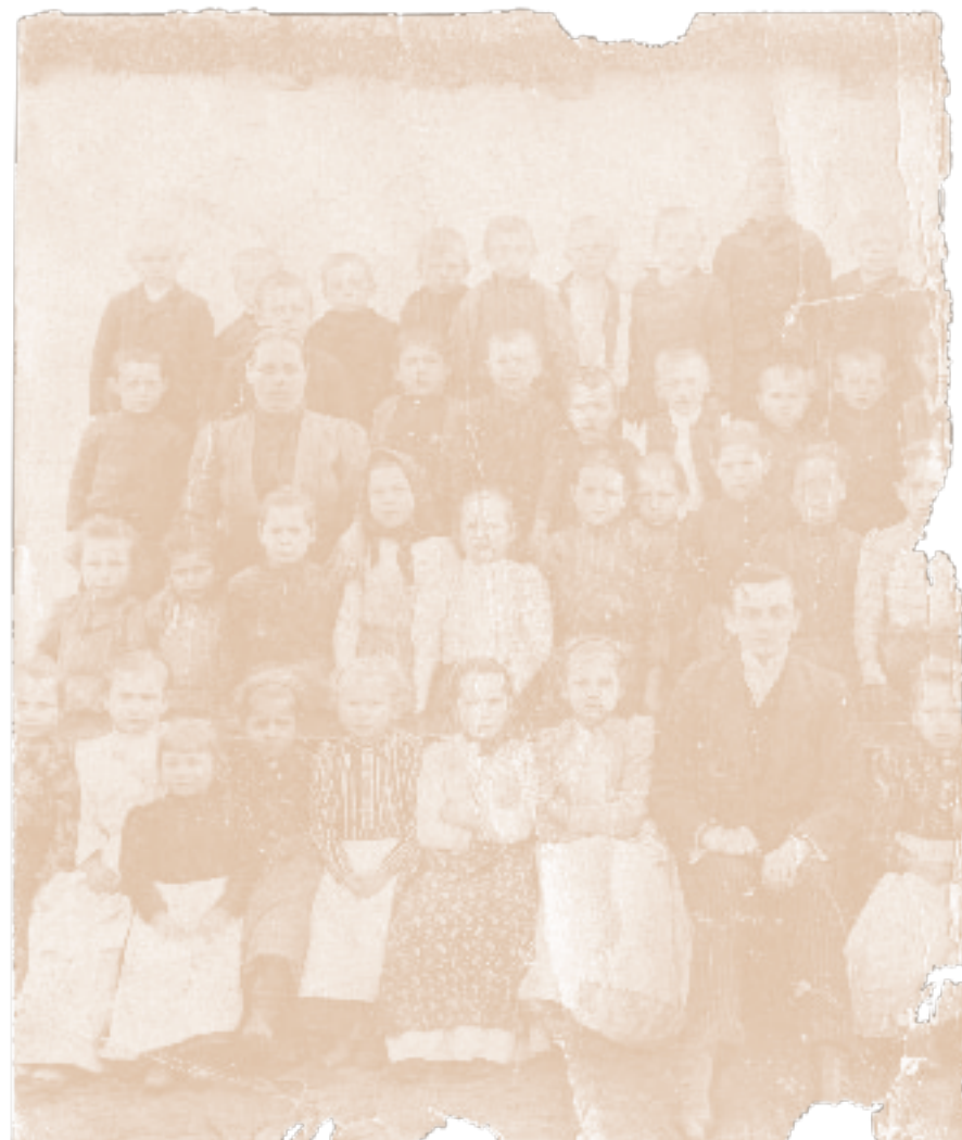
1920-as évekbeli csoportképtöredék