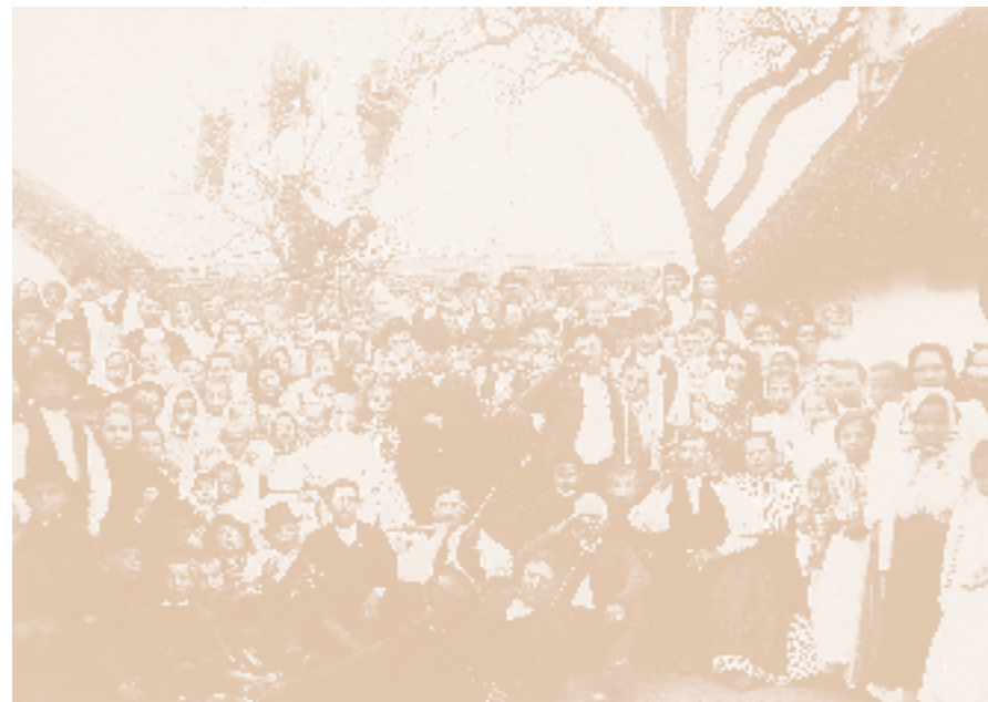
Húsvéti mulatságon készült csoportkép 1911-ből