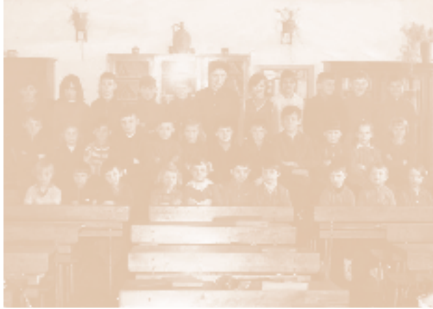
Az 1969–1974 között Szőlőben tanuló osztály képe