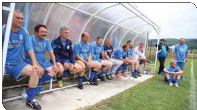
Az etédi öregfiúk...

2018. június 17-én az erdőszentgyörgyi futballpályán összegyűlt közönség igazi nyári sportvasárnap részese lehetett. Örömfocit láthattak a sportkedvelők a három Öregfiú csapat tagjaitól, valamint a Küllő Sportklub két reményteli ifjúsági csapatától.