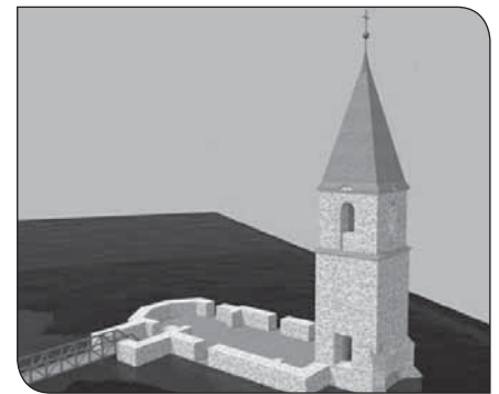
Az Összetartozás templomának látványterve

És végül körvonalazódik egy igen merész terv megvalósítása: az összeomlott katolikus templom újraépítésének terve. A felépítést