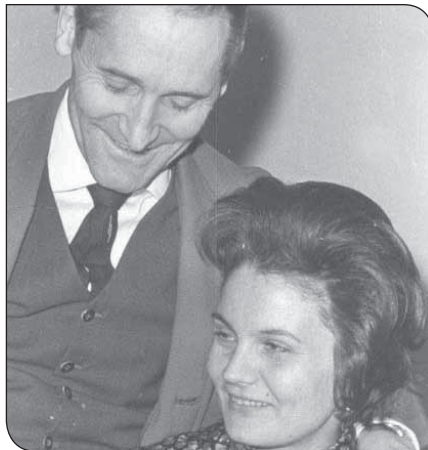
A költő és hitvese, Tichy Magdolna a hatvanas évek elején

„Kányádi Sándor (...) költészetének legfontosabb üzenete a szülőföld szeretetének a parancsa. A szülőföldé, amely nem elvont eszme, hanem a mindennapok valóságából, az emlékekből, az átöröklött hagyományokból formálódott, földrajzilag is behatárolható területen megvalósuló táj-kultúra-ember egysége. A költő pedig nem tett mást – ahogy mondani szokta –, mint leírta, amit látott.