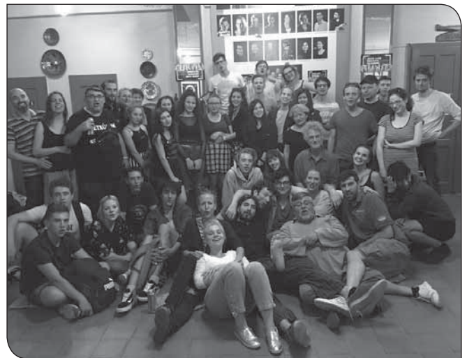
Csoportkép a fesztivál résztvevőiről