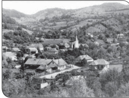
Bözödújfalú az elárasztás előtt...