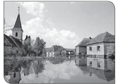
Emelkedik a víz...

A gátépítés már 1975-ben megindult, 1977-ben leállt, de 1984-től újrakezdték. 1985-