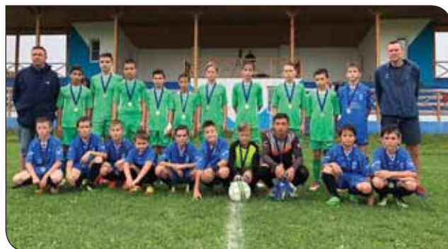
... és az erdőszentgyörgyi foci reménységei