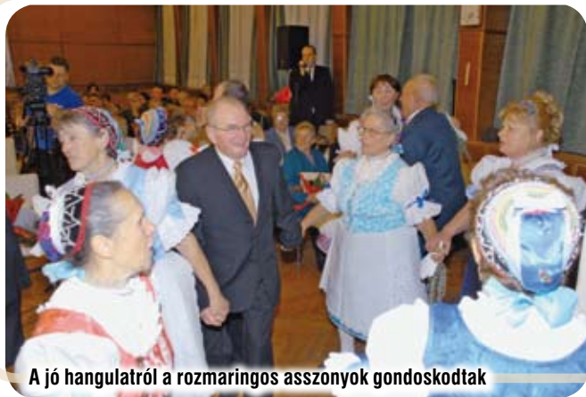
A jó hangulatról a rozmaringos asszonyok gondoskodtak