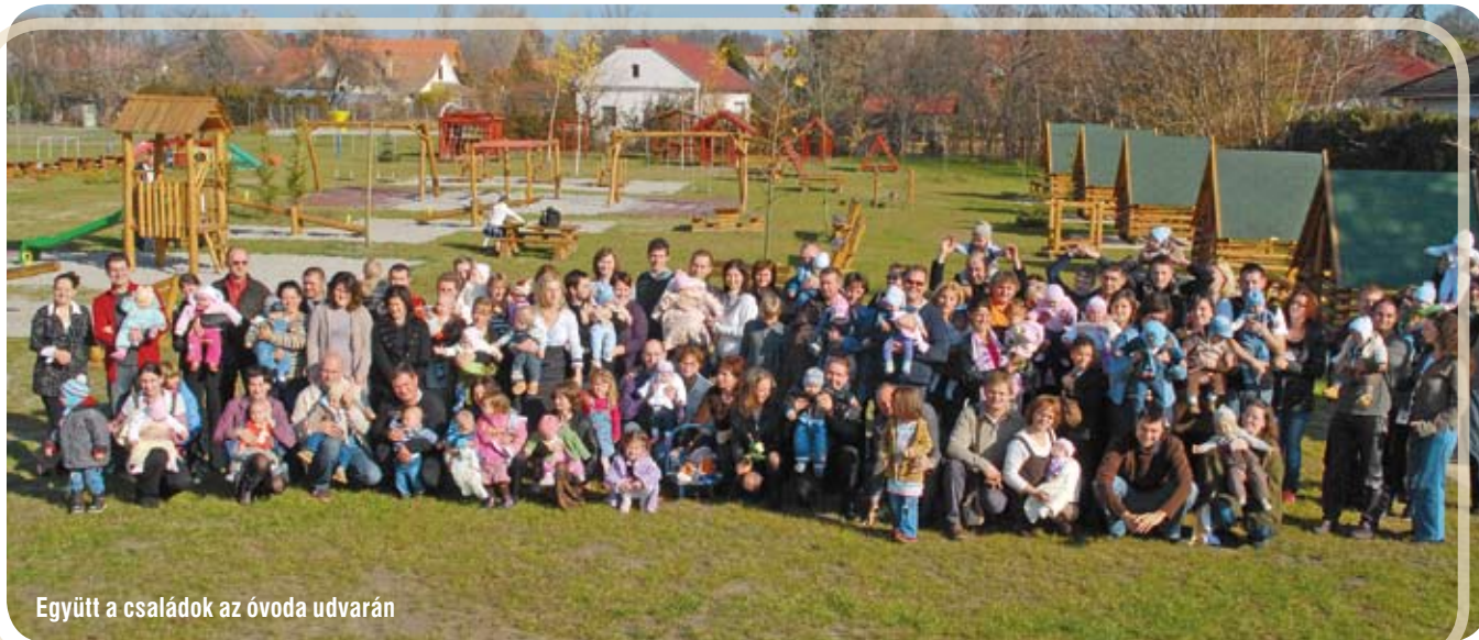
Együtt a családok az óvoda udvarán