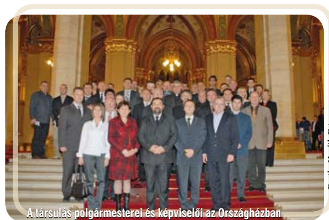
A társulás polgármesterei és képviselői az Országházban